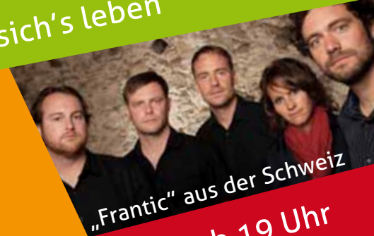
„Frantic“ aus der Schweiz

Openair-Konzert am Samstag ab 19 Uhr Eintritt Frei!