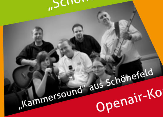
„Kammersound“ aus Schönefeld